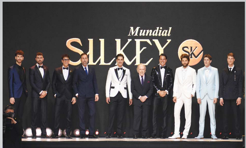
Gran cierre de la espectacular pasada de Matices.

En el espectacular Evento de Moda y Belleza más importante de América Latina, Salón Internacional Moda & Coiffure 2024, Matices presentó su colección de moda y tendencia masculina para todos los estilos. ♦