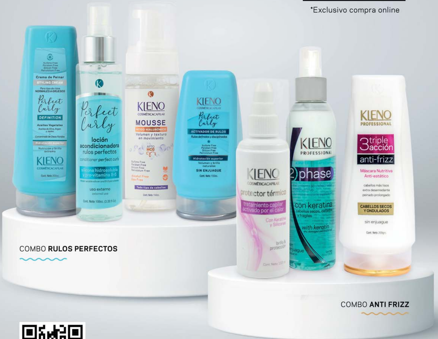
COMBO RULOS PERFECTOS